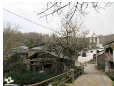
San Cristovo do Real Lugo