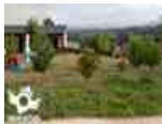
San Mamede do Camiño Lugo