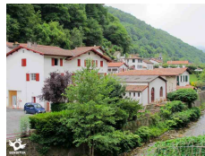
Arnéguy, Pyrénées Atlantiques