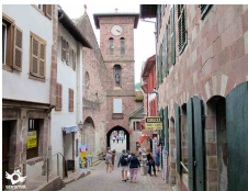
Saint Jean Pied de Port Pyrénées Atlantiques