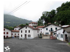
Ondarolle Pyrénées Atlantiques